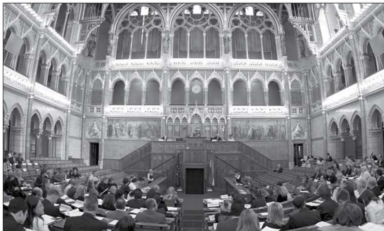
Мађарски Парламент до даљњег без мањинских посланика

нето и решење о формирању Форума националних и етничких мањина у Мађарској. Форум се састоји од представника мањина, председавајућег Парламента и представника посланичких група. Декларисани циљ овог форума је да се гарантује присуство националних и етничких заједница у парламентарним расправама која дотичу њихове ин-